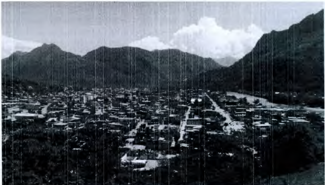
Tingo María 9

La Provincia de Leoncio Prado es la segunda provincia más importante de Huánuco, y a su capital el Distrito de Tingo María se le conoce como la puerta de entrada a la Amazonia, la cual se encuentra a orillas del Río Huallaga rodeada de la imponente Bella Durmiente.