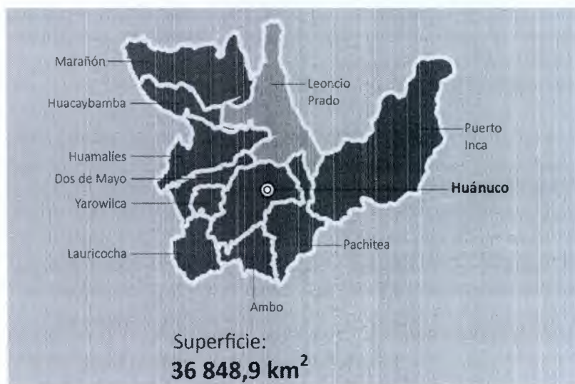
Mapa de la Provincia de Leoncio Prado

A través de la Ley N° 11843, de fecha 17 de mayo de 1952, se creó la Provincia de Leoncio Prado, la cual fue sustituida con el nombre de Leoncio Prado a través de la Ley N° 12671 de fecha 30 de noviembre de 1956.