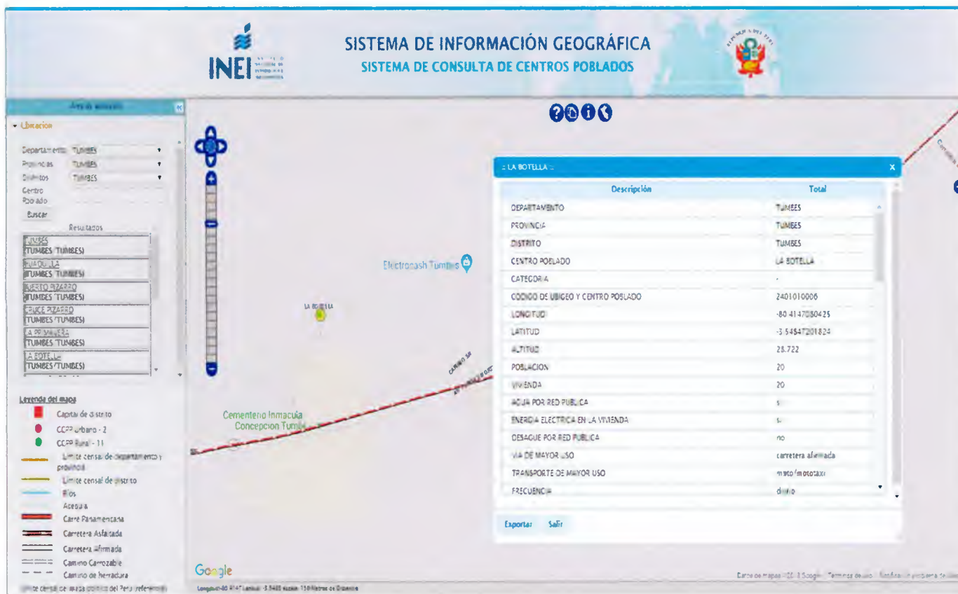
Pág. 08. Fuente: INEI: Censos Nacionales 2017: XII de Población, VII de Vivienda y III de Comunidades Indígenas.