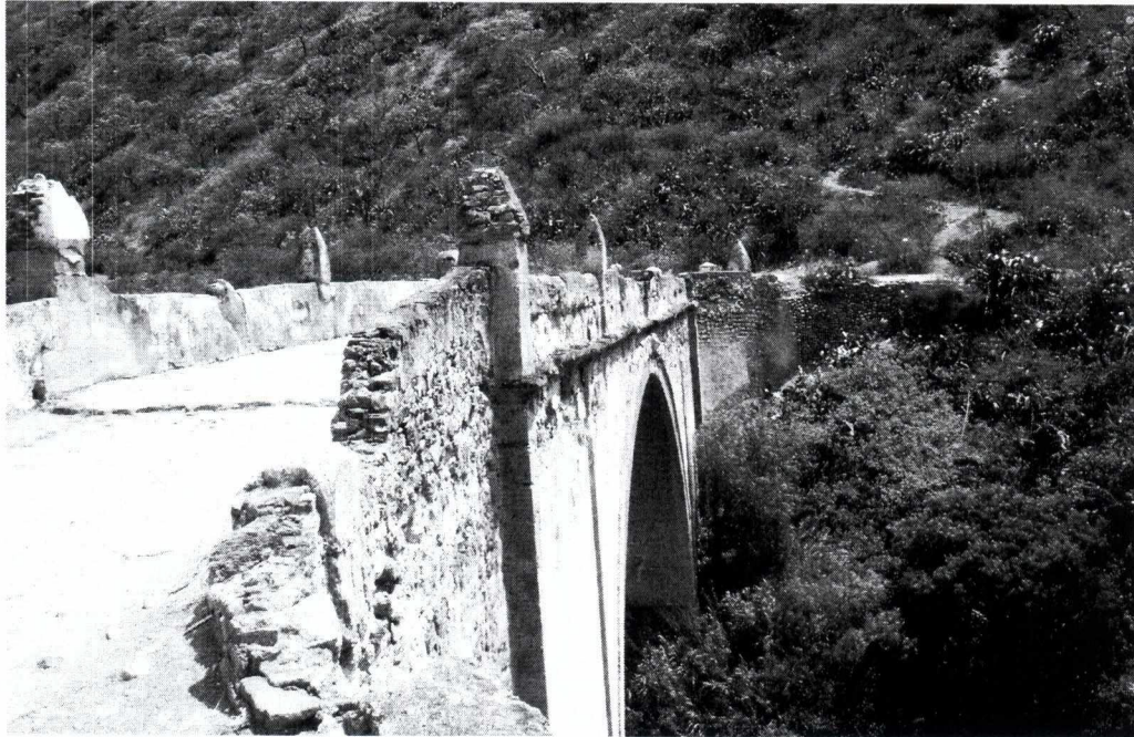
Vista parcial del Puente Pachachaca 18

VI. Lo cierto es que actualmente el Puente de Pachachaca se encuentra en un estado verdaderamente precario, pues actualmente no recibe un mantenimiento adecuado, lo cual hace que esté en peligro de destrucción.