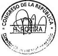
MIRTHA ESTHER VÁSQUEZ CHUQUILIN Presidenta a. i. del Congreso de la República

En Lima, a los ocho días del mes de abril de dos mil veintiuno.