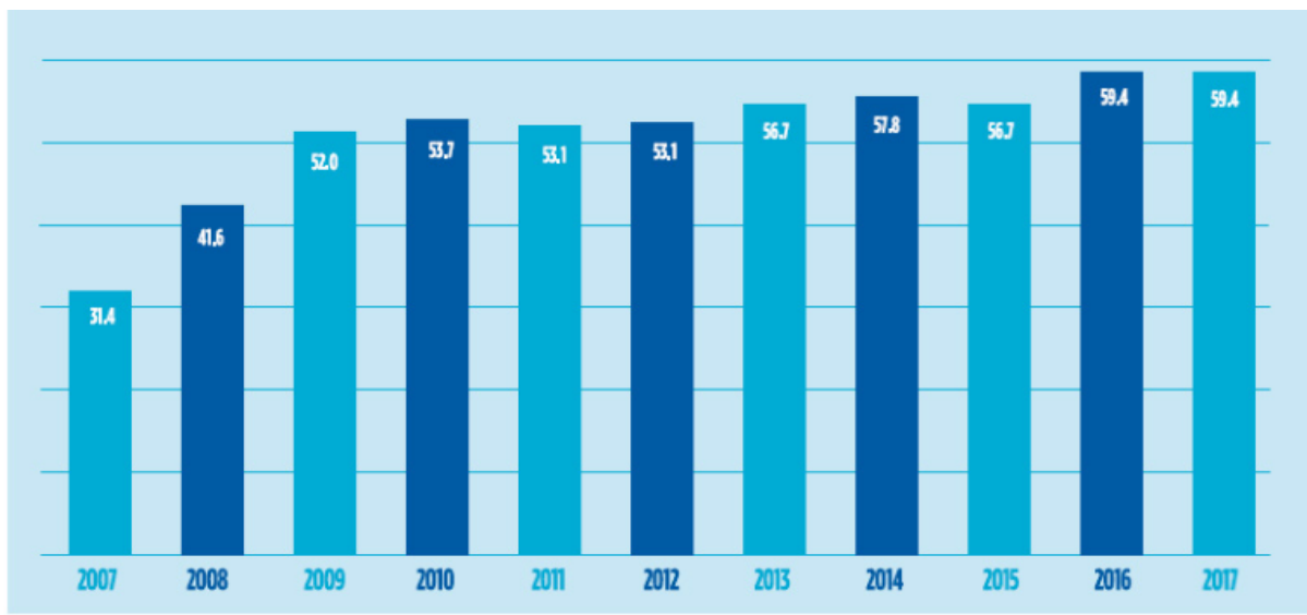
Gráfico 02: Utilidades (en millones de soles)