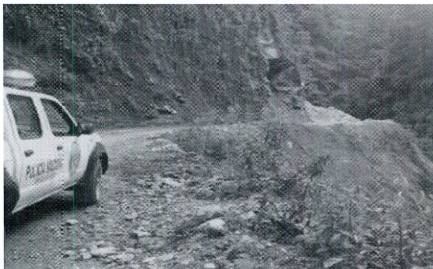
Carretera de Oxapampa bloqueada.

Estas medidas son tomadas debido a los daños materiales y pérdidas humanas que se han sufrido producto de la destrucción de la carretera, única vía de acceso a Pozuzo desde Oxapampa, inhabilitándola e impidiendo el tránsito de los vehículos, motivando que las autoridades locales desplieguen maquinaria pesada como tractor oruga, excavadora, o cargador frontal, entre otros, siendo el caso más reciente el suscitado el 20 de diciembre de 2019, producto del cual dicha vía de acceso fue reestablecida temporalmente recién el 28 de diciembre, pero en enero de 2020 la carretera nuevamente se vio interrumpida, extendiéndose los trabajos de recuperación hasta abril del presente año, los cuales se suspendieron debido a la pandemia del Covid-19 6 .