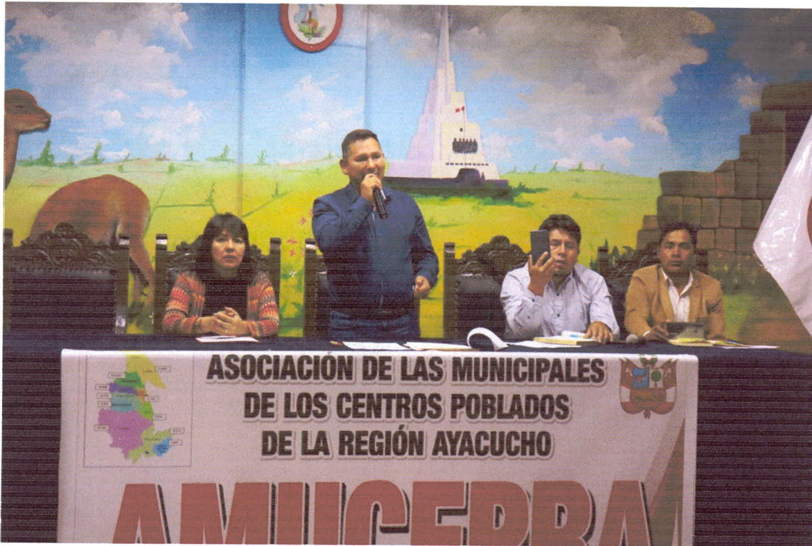
Foto: Evento de Centros Poblados Ayacucho.