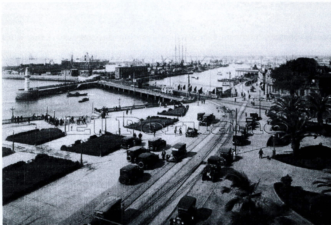
Puerto del Callao en 1930.