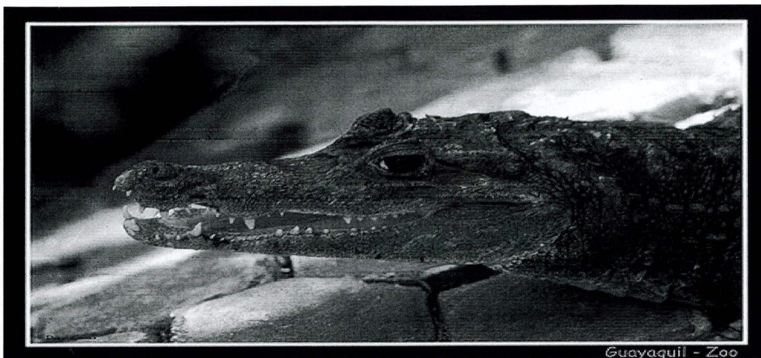
"Cocodrilo de Tumbes"

Desde los años 1997, 1998 y 1999 a la fecha no se han dictado medidas necesarias de repoblamiento, protección o restauración, así como la factibilidad de su aprovechamiento sostenible.