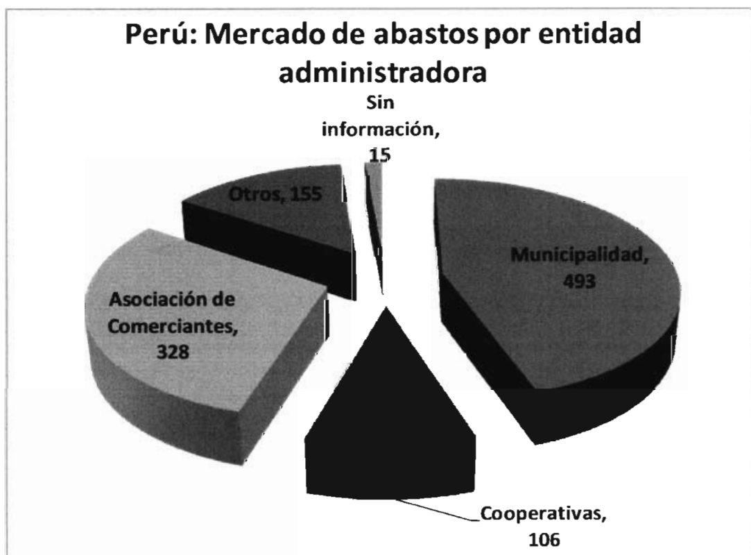
Gráfico N° 02