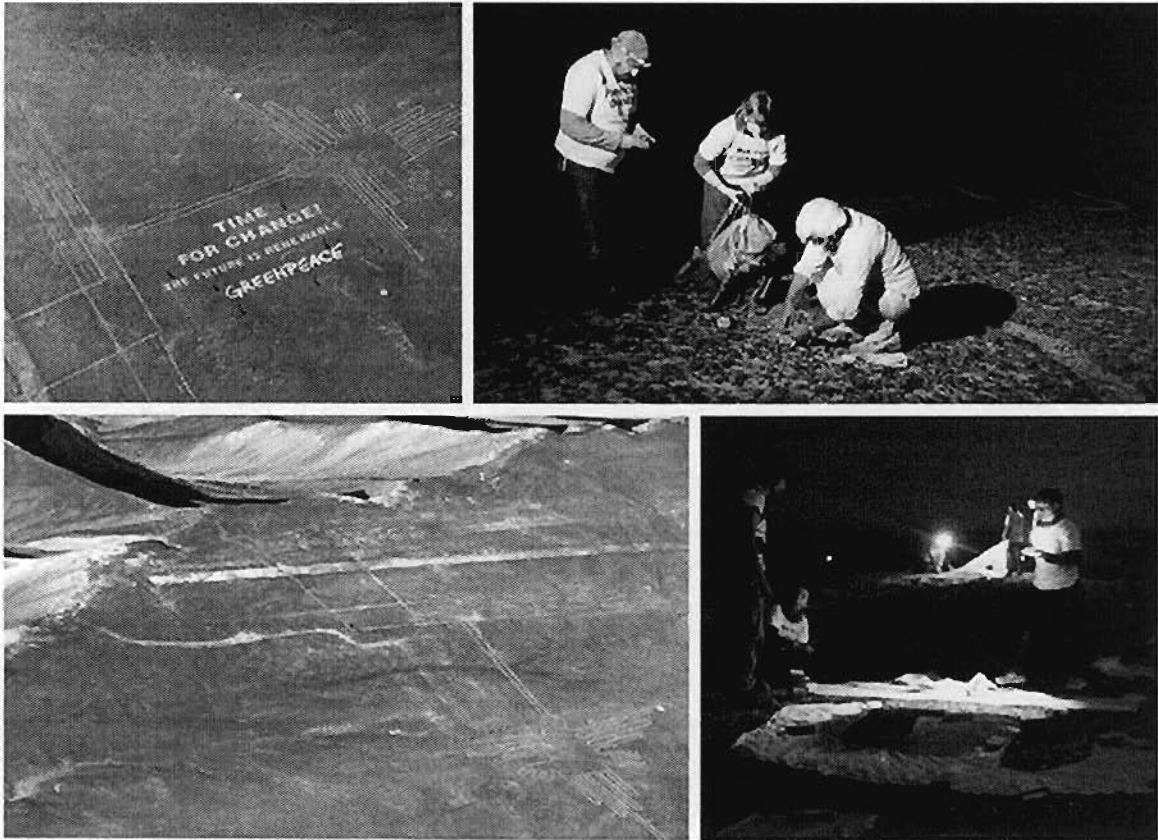
Fotos de la invasión de la empresa GEERNPEACE a líneas de Nasca.