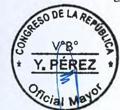
MIRTHA ESTHER VÁSQUEZ CHUQUILIN Presidenta a. i. del Congreso de la República