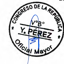
MIRTHA ESTHER VÁSQUEZ CHUQUILIN Presidenta a. i. del Congreso de la República

En Lima, a los veintinueve días del mes de diciembre de dos mil veinte.