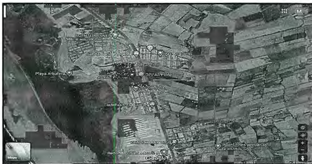
Cuadro N° 03 Ubicación del Futuro Distrito de Medio Mundo