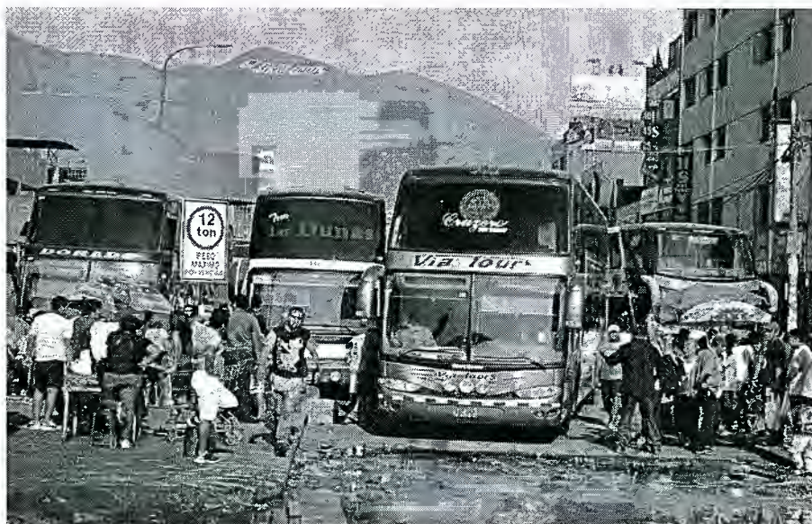
CUADRO I TERMINAL INFORMAL DE LIMA NORTE