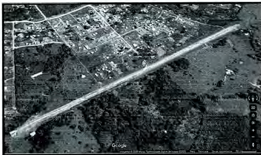
Grafico 3: Aerodromo de Constitución

despegue de avionetas. Este aeródromo sirve como medio de transportes de personas y carga ligera.