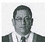
19. VIVANCO REYES, MIGUEL ÁNGEL (Fuerza Popular)