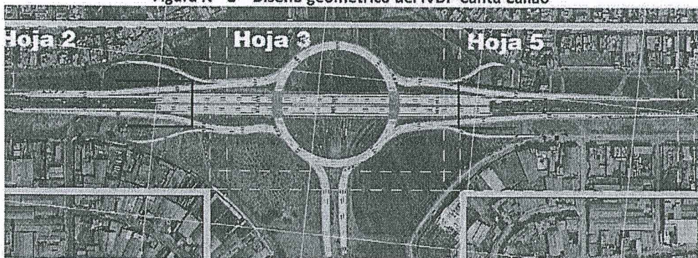
Figura N° 2 – Diseño geométrico del IVDP Santa Callao

El diseño aprobado contempla la construcción de un intercambio rotatorio a desnivel con la carretera Panamericana Norte, parcialmente deprimida en zanjón y la glorieta, parcialmente elevada sobre la cota natural del terreno (Ovalo), la cual conectara la av. Trapiche con la futura av. Santa Callao, con la finalidad de descongestionar el tráfico existente en la zona y permitiendo una conectividad más rápida y fluida del tránsito.