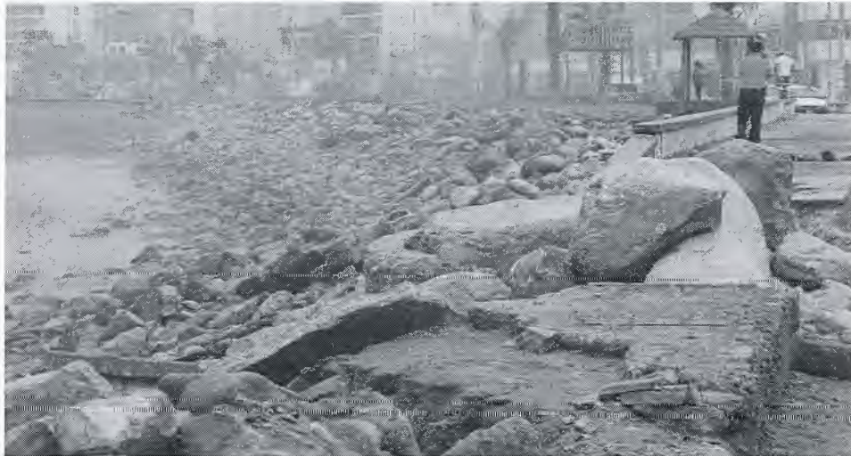
Figura N° 3 Vista del Borde costero en degradación y erosión

Se calcula que se requiere transportar un volumen de 60'000,000 m 3 de arena ubicadas en la parte sur de la construcción del Molón, para ganar mayor playa costera en el lado norte. Esta construcción realizada por el Terminal Portuario de Salaverry ha ocasionado que se altere la geografía natural de las playas en la parte norte, los cuales se encuentran erosionados y en pérdida de su línea costera.