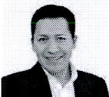
5. ARAPA ROQUE, JESÚS ORLANDO

Firmado digitalmente por: ARAPA ROQUE Jesus Orlando FAU 20161740126 soft Motivo: En señal de conformidad Fecha: 16/06/2020 18:03:43-0700