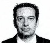
21. TORRES MORALES, MIGUEL ÁNGEL (Fuerza Popular)