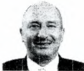
1. ELÍAS ÁVALOS, MIGUEL ÁNGEL Presidente (Fuerza Popular)