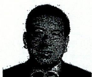
8. GONZALES ARDILES, JUAN CARLOS EUGENIO (Fuerza Popular)

"Decenio de la Igualdad de Oportunidades para mujeres y hombres" "Año de la Lucha contra la Corrupción y la Impunidad"