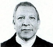
16. ARANA ZEGARRA, MARCO ANTONIO

(Frente Amplio por Justicia, Vida y Libertad)