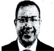
1. Román Valdivia Miguel Acción Popular Presidente