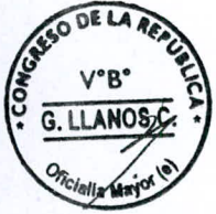
LEYLA CHIHUÁN RAMOS Primera Vicepresidenta del Congreso de la República