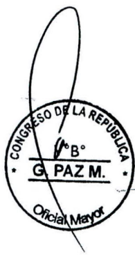
DANIEL SALAVERRY VILLA Presidente del Congreso de la República

A stylized handwritten signature in black ink.