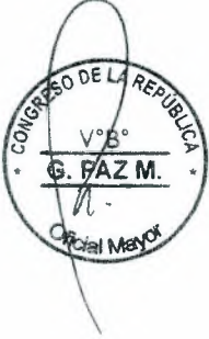
DANIEL SALAVERRY VILLA Presidente del Congreso de la República

Comuníquese al señor Presidente de la República para su promulgación. En Lima, a los nueve días del mes de noviembre de dos mil dieciocho.