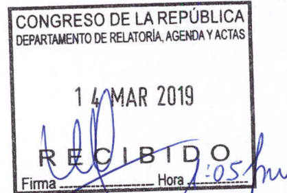
NELLY CUADROS CANDIA Congresista de la República