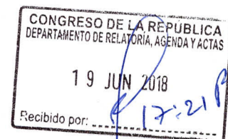
Figueroa Minaya Modesto Congresista de la República