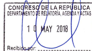
FRANCISCO PETROZZI FRANCO Congresista de la República