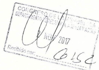
EHEVARRIA HUAMAN, SONIA Congresista de la República