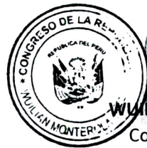
WILIAN MONTEROLA ABREGU Congresista de la República