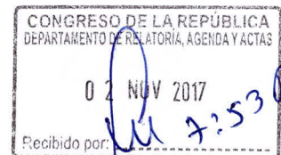
LETONA PEREYRA, URSULA Congresista de la República