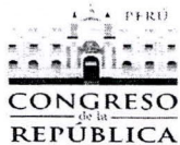
ROSA BARTRA BARRIGA Congresista de la República