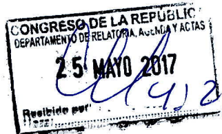
Saavedra Vela Esther Congresista de la República