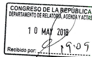
URSULA LETONA PEREYRA Congresista de la República