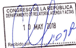
ISRAEL TITO LAZO JULCA Congresista de la República