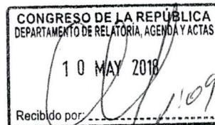
MODESTO FIGUEROA MINAYA Congresista de la República