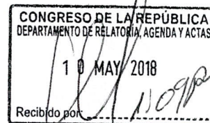
TAMAR ARIMBORGO GUERRA Congresista de la República