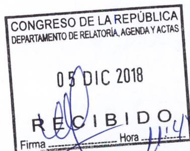
VICTOR ALBRECHT RODRÍGUEZ Congresista de la República