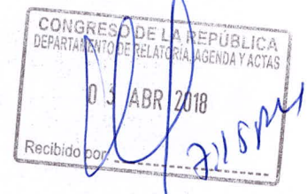
ROSA MARIA BARTRA BARRIGA Congresista de la República