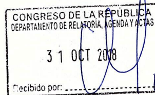
Wuilian Monterola Abregu Congresista de la República