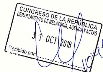
Nelly Cuadros Candia Congresista de la República