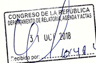
Ticlla Rafael Carlos Humberto Congresista de la República