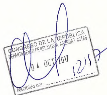
JANET SÁNCHEZ Congresista de la República Grupo Parlamentario Peruanos Por el Cambio