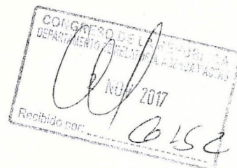
ECHÉVARRIA HUAMAN, SONIA Congresista de la República