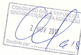
MONTEROLA ABREGU, WUILIAN Congresista de la República