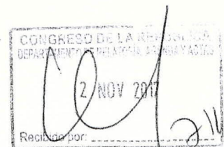
NOCEDA CHIANG, PALOMA Congresista de la República