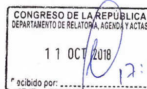
ROY VENTURA ÁNGEL Congresista de la República