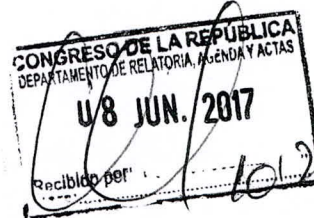
SEGUNDO TAPIA BERNAL Congresista de la República