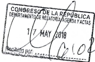
DALMIRO PALOMINO ORTIZ Congresista de la República