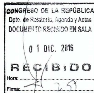
KENJI FUJIMORI HIGUCHI Congresista de la República