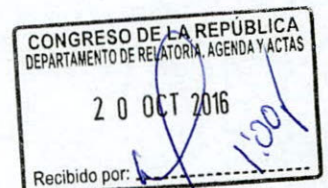
OSIAS RAMIREZ GAMARRA Congresista de la República