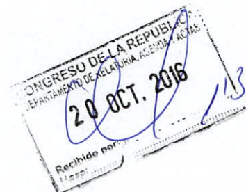
SONIA ECHEVARRIA HUAMAN Congresista de la República