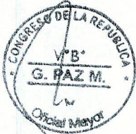
LEYLA CHIHUÁN RAMOS Primera Vicepresidenta del Congreso de la República