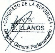
DANIEL SALAVERRY VILLA Presidente del Congreso de la República

Comuníquese al señor Presidente de la República para su promulgación. En Lima, a los diecisiete días del mes de junio de dos mil diecinueve.