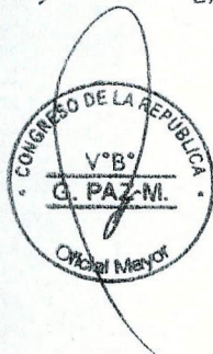
DANIEL SALAVERRY VILLA Presidente del Congreso de la República