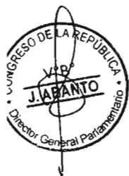
MAURICIO MULDER BEDOYA Tercer Vicepresidente del Congreso de la República